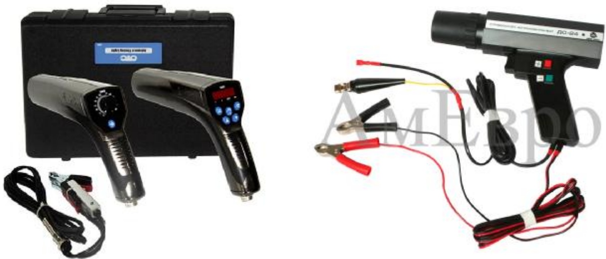
Рис. 3. Электронные стробоскопы

В качестве стробоскопа может использоваться вращающийся диск с секториальной прорезью (рис. 4). Стробоскопический эффект достигается за счет совпадения скорости вращения изучаемого объекта и скорости вращения диска, позволяющего осматривать объект через равные промежутки времени.