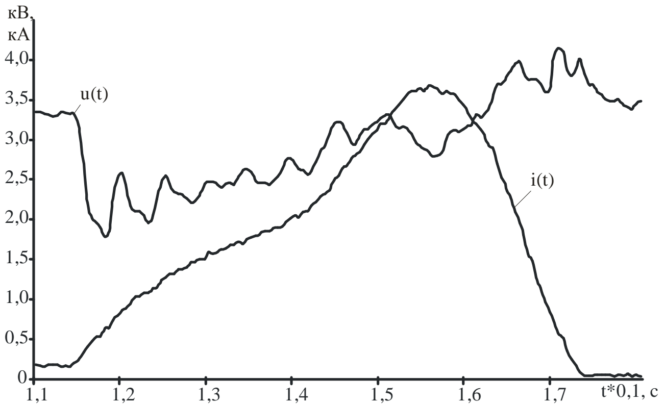
Рис.1. Тимчасові залежності фідерної напруги і струму однієї з тягових підстанцій Придніпровської залізниці в режимі КЗ

Наведені вище міркування про ПЯЕ відносяться і до енергетичних характеристик (показників) системи електротяги і, зокрема, до коефіцієнта потужності I , і до коефіцієнта реактивної потужності tgj .